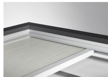
(S) elektrische binnenzonwering

De iWindow opengaande glaskoepels zijn geschikt voor platte daken en kunnen geplaatst worden onder een helling tussen min. 4° en 25°. Om vervuiling van de buitenkant van het glas te voorkomen wordt een helling van minimum 5° geadviseerd.