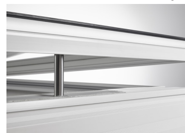
(O) opengaand met spindelmotor